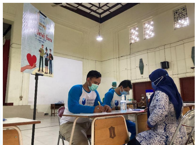
StAULA SMAN 1 (staf Humas melakukan proses reregistrasi kepada guru)