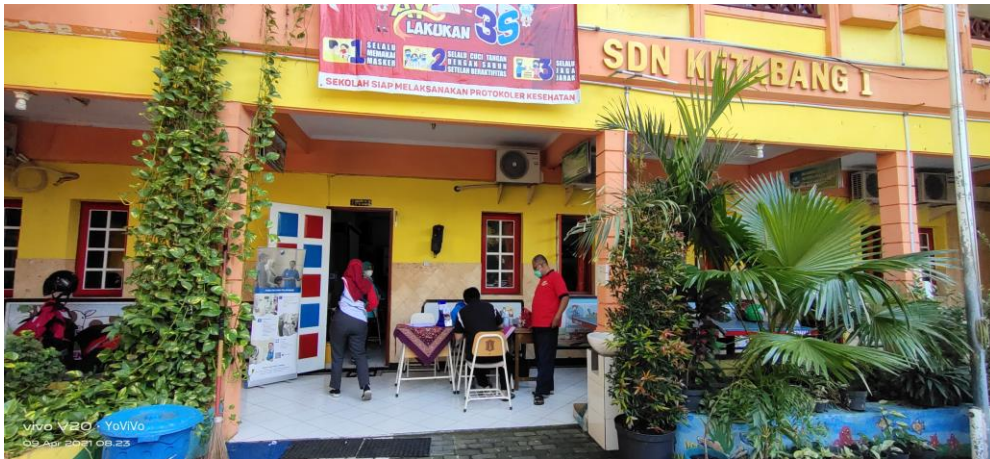
DEPAN SALAH SATU KELAS SDN KETABANG 1 (proses pendaftaran)