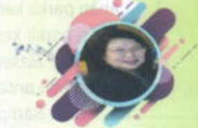
dr. Iwihorah, M.Sc, FISQua (Tgl 22 – Des – 2020, 10.15 – 14.00 WITA)