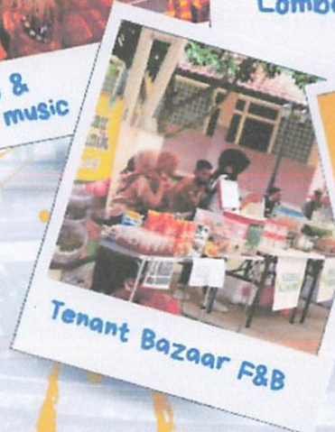
Tenant Bazaar F&B