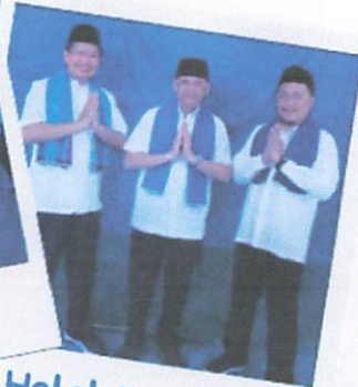
Halal Bi Halal