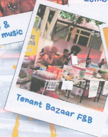
Tenant Bazaar F&B