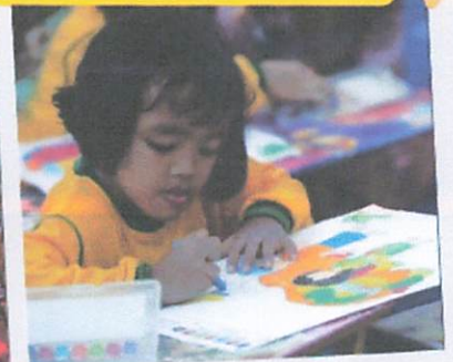
Lomba Mewarnai TK