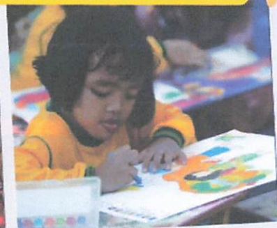
Lomba Mewarnai TK