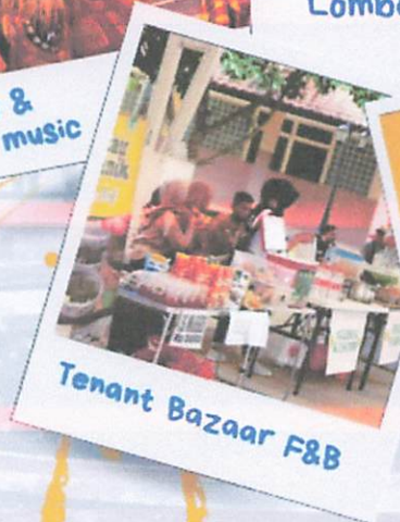
Tenant Bazaar F&B