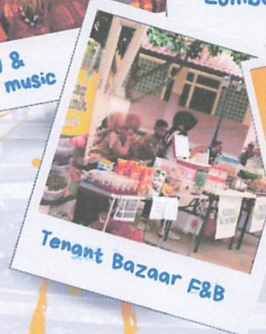
Tenang Bazaar F&B