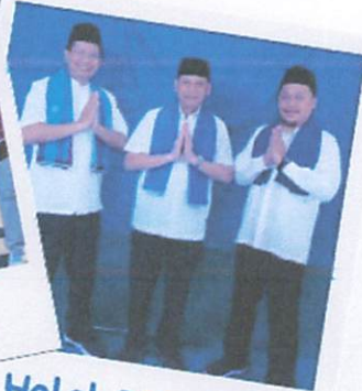
Halal Bi Halal