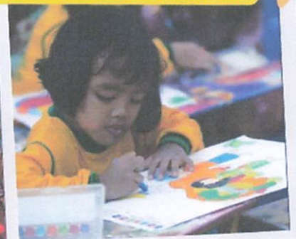
Lomba Mewarnai TK