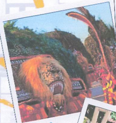
Reog & Live music