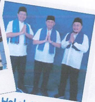
Halal Bi Halal