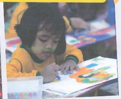
Lomba Mewarnai TK