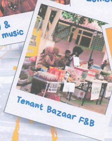
Tenant Bazaar F&B