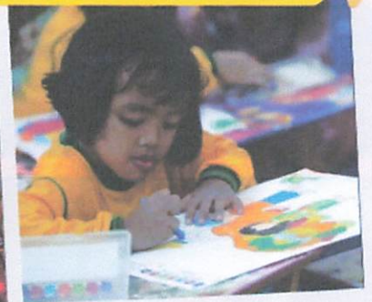
Lomba Mewarnai TK