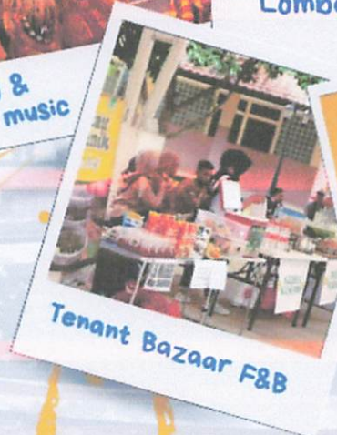
Tenant Bazaar F&B