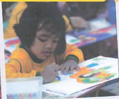
Lomba Mewarnai TK