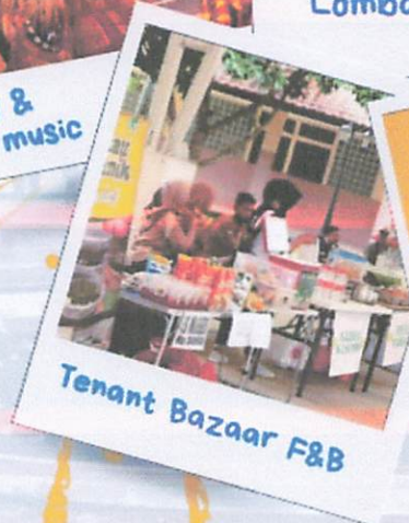
Tenant Bazaar F&B