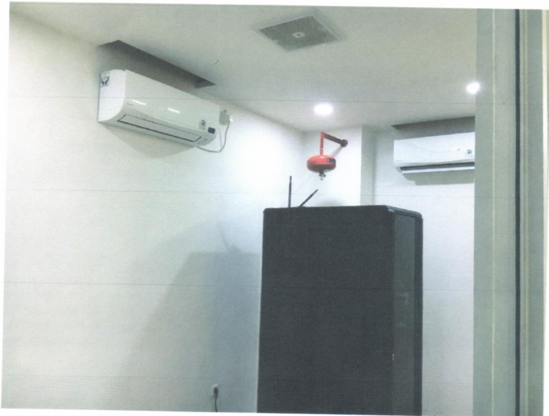
Ruang Server Backup Lantai 7