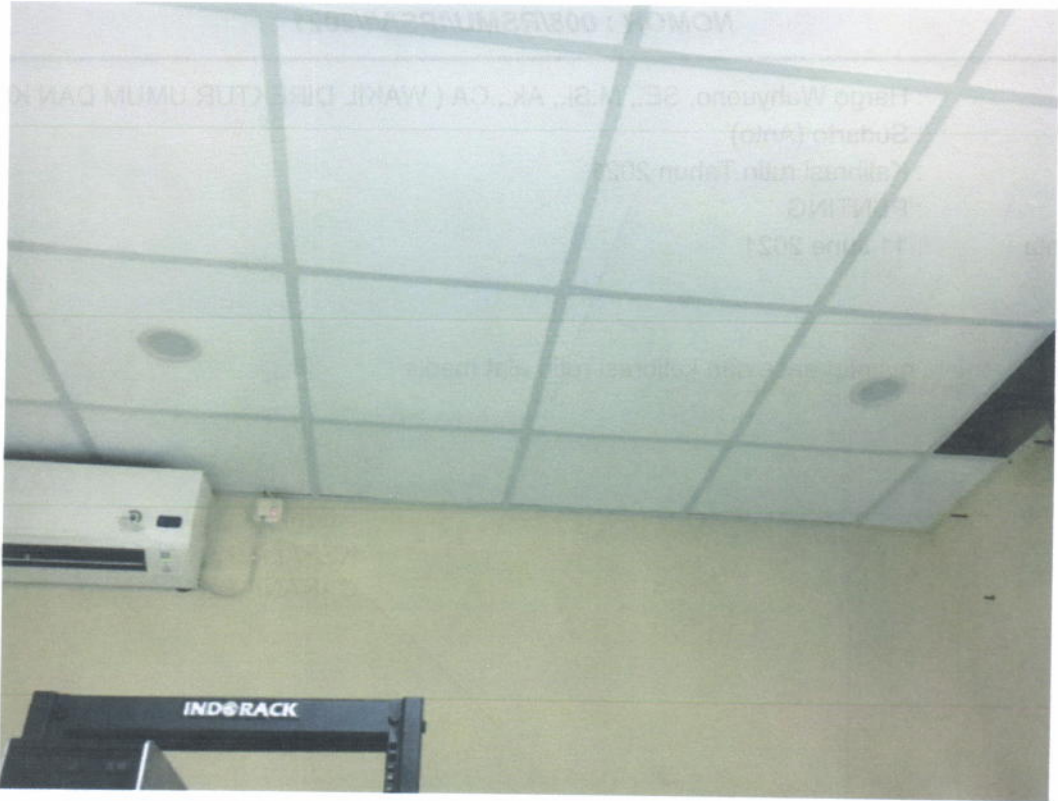
Ruang Server Utama Lantai 2