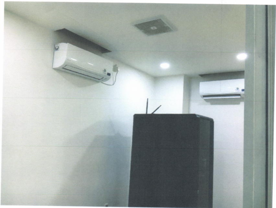
Ruang Server Backup Lantai 7