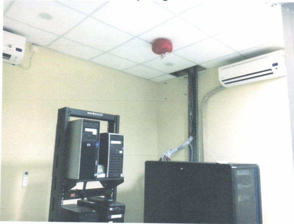
Ruang Server Utama Lantai 2