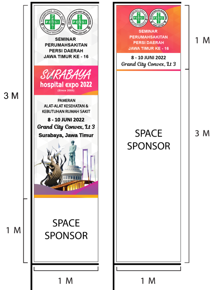
Gambar : Umbul - Umbul