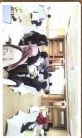
IN HOUSE TRAINING PT. SEMEN INDONESIA, Tbk.