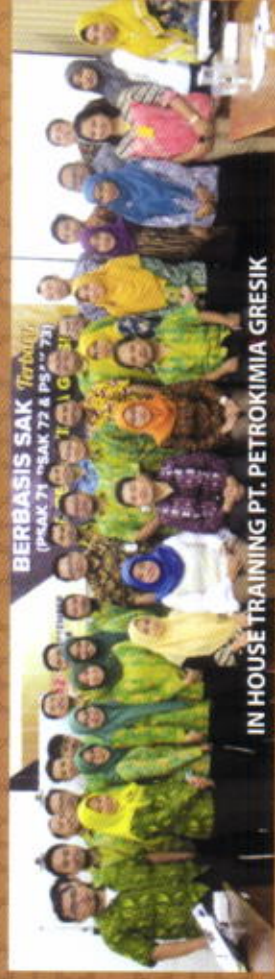
IN HOUSE TRAINING PT. PETROKIMIA GRESIK

Biaya penyelenggaraan kegiatan pelatihan akan ditentukan kemudian, dan tergantung pada topik dan lama pelatihan. Secara umum biaya pelatihan akan meliputi komponen biaya instruktur, materi pelatihan, training kit, fee IAI dan lain-lain