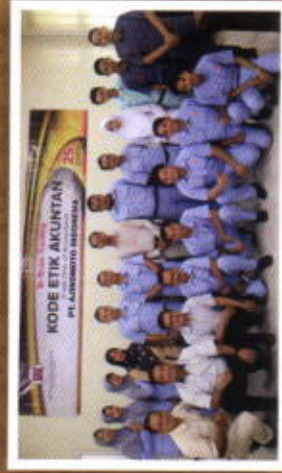
IN HOUSE TRAINING PT. AJINOMOTO INDONESIA