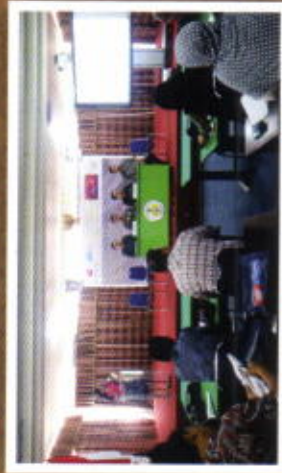
IN HOUSE TRAINING POLITEKNIK NEGERI MANADO