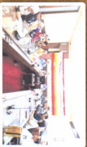
IN HOUSE TRAINING ANAK PERUSAHAAN PLN GROUP