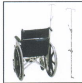
Kursi Roda dengan Standard Infus untuk Rumah Sakit