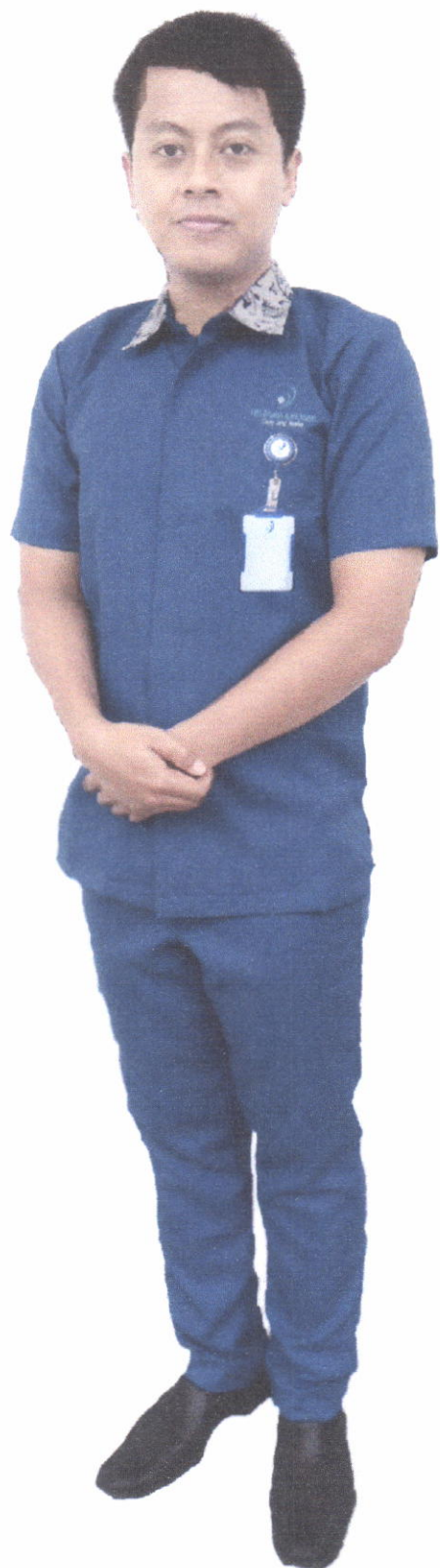
Seragam Tenaga Administrasi (Laki - Laki)