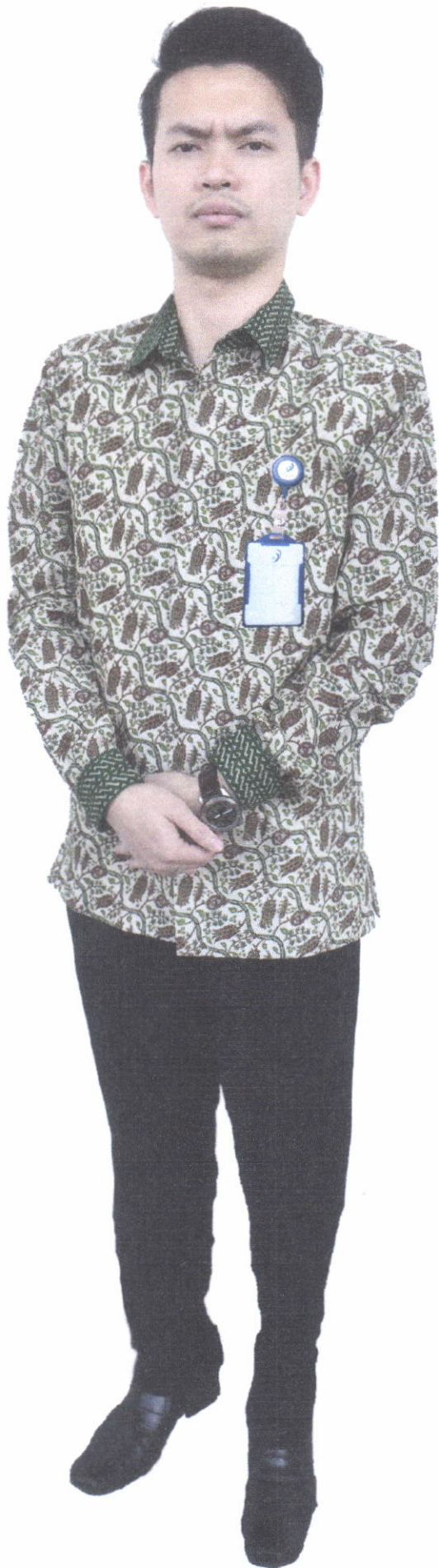
Seragam Struktural Batik (Laki - Laki)