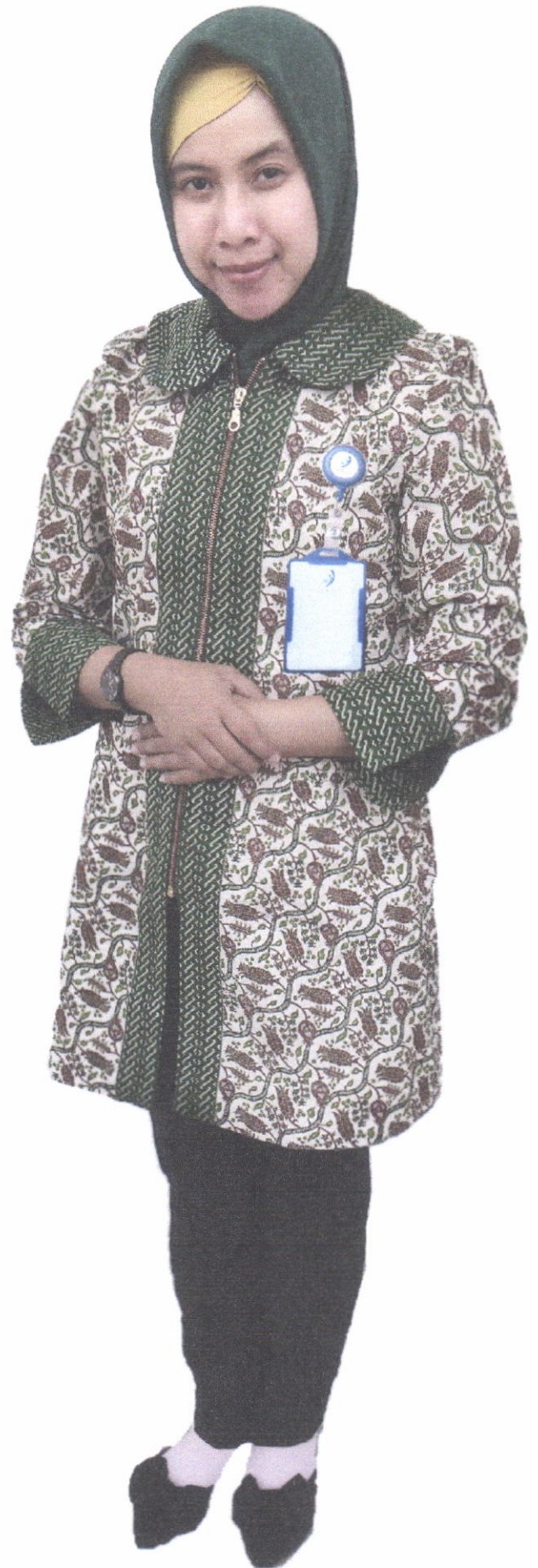
Seragam Struktural Batik (Wanita)