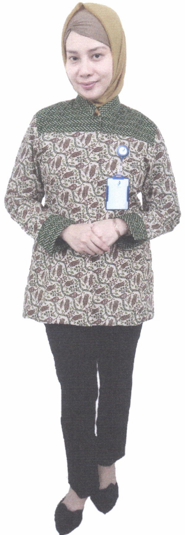
Seragam Tenaga Administrasi Batik (Wanita)