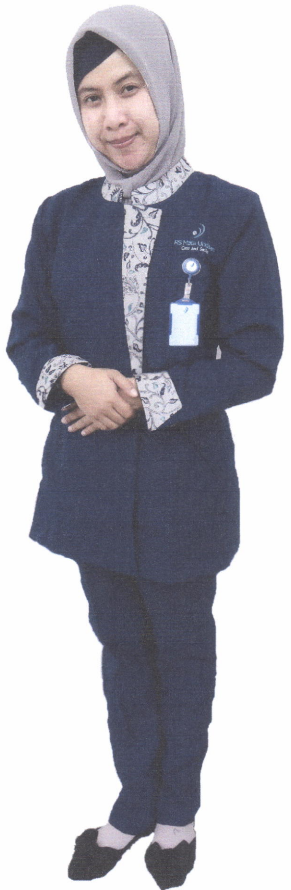
Seragam Struktural (Wanita)