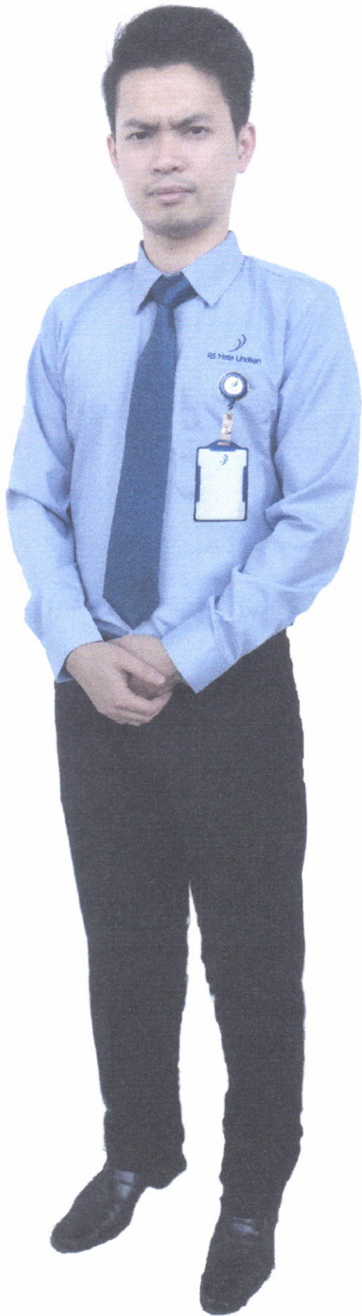
Seragam Struktural (Laki - Laki)