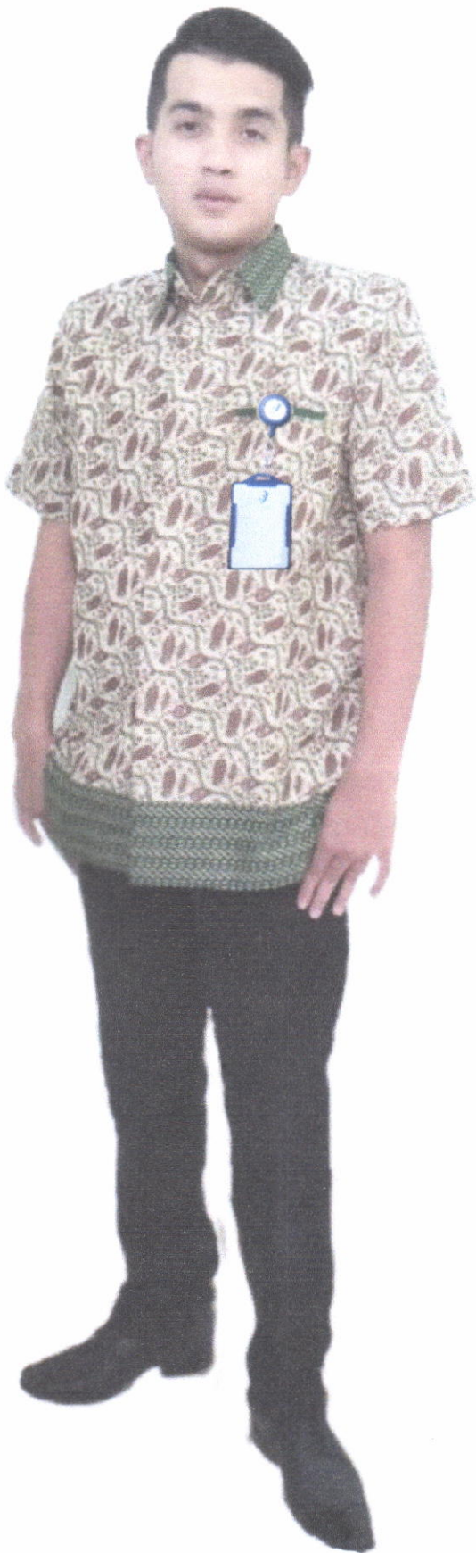
Seragam Tenaga Kesehatan Batik (Laki - Laki)