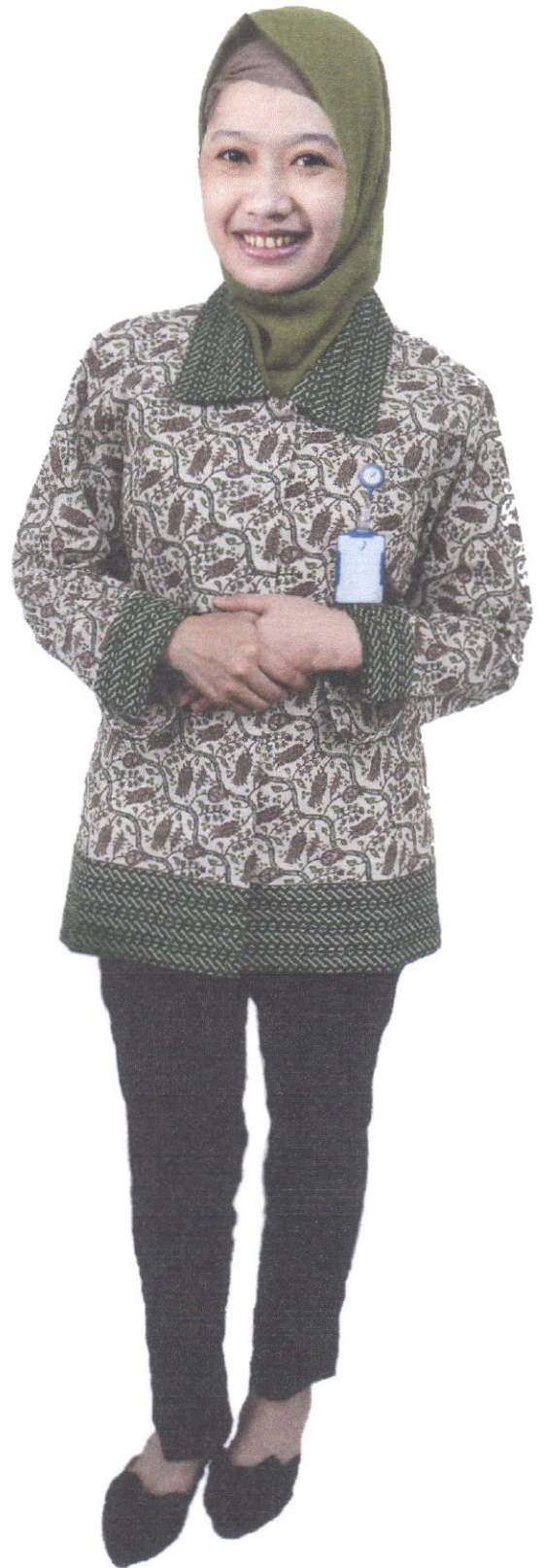
Seragam Tenaga Kesehatan Batik (Wanita)