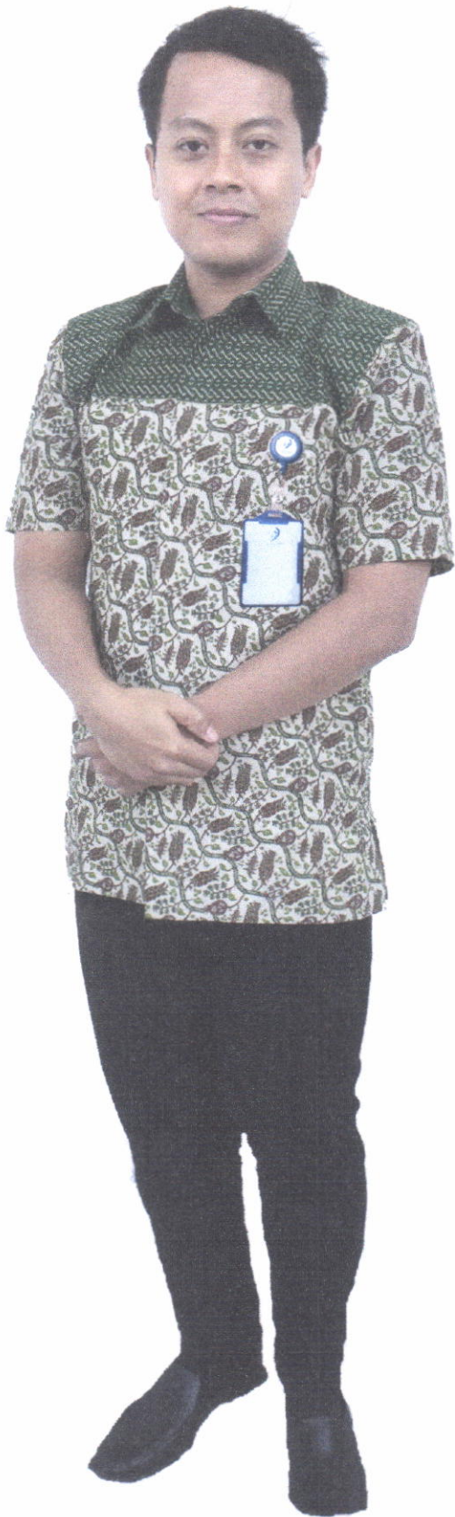
Seragam Tenaga Administrasi Batik (Laki - Laki)