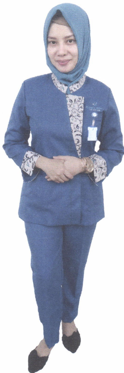
Seragam Tenaga Administrasi (Wanita)