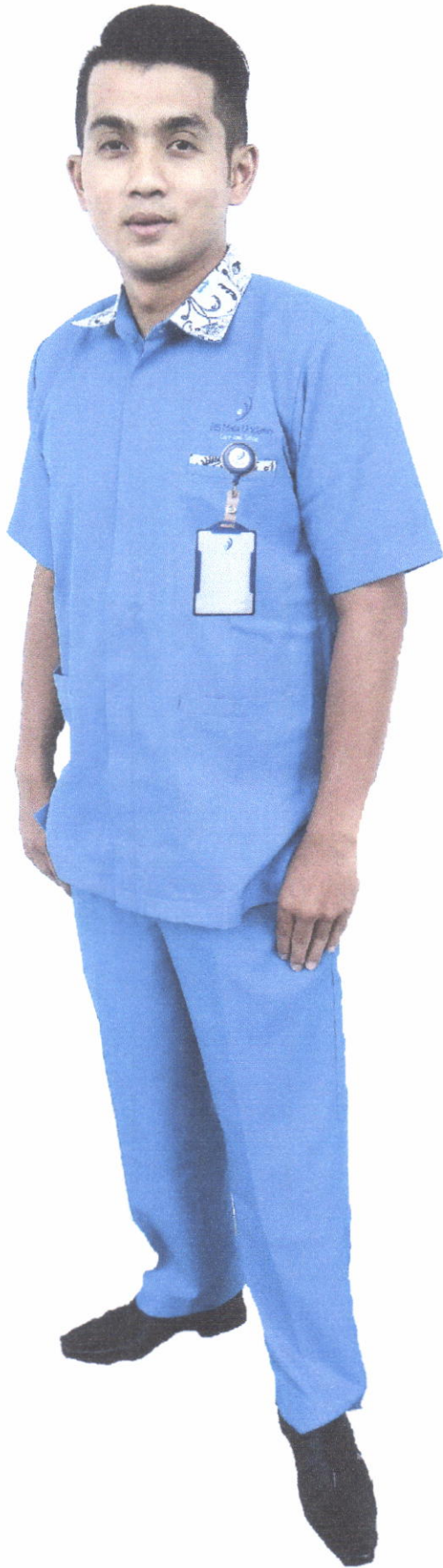
Seragam Tenaga Kesehatan (Laki - Laki)