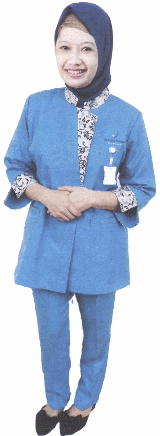
Seragam Tenaga Kesehatan (Wanita)