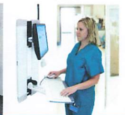
Di koridor rumah sakit