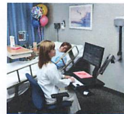
Di ruang rawat inap