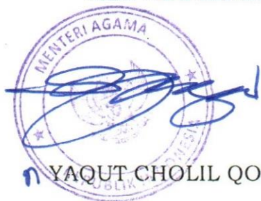
YAQUT CHOLIL QOUMAS