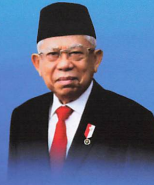
KH. MA'RUF AMIN* (Wakil Presiden Republik Indonesia)