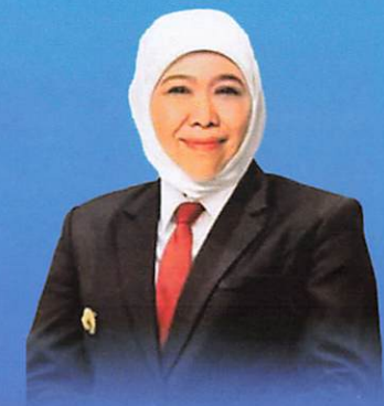
KHOFIFAH INDAR PARAWANSAH* (Gubernur Jawa Timur)