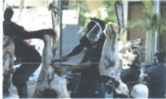
Proses pemotongan hewan kurban sapi (patungan 7 orang)