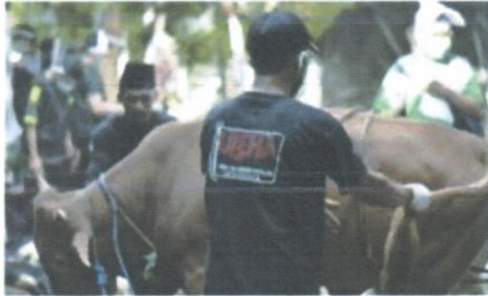
Proses penyembelihan hewan kurban sapi (patungan 7 orang)