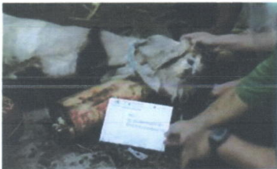
Proses penyembelihan hewan kurban kambing