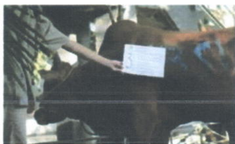
Hewan kurban (sapi) Idul Adha tahun 1441 H, patungan 7 orang