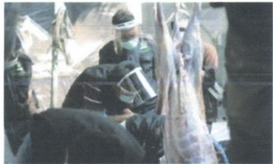
Proses pengulitan dan pemotongan hewan kurban kambing