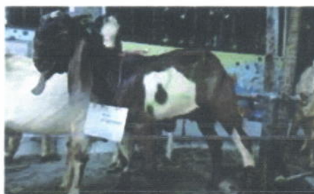
Hewan kurban (kambing) idul adha tahun 1441H, salah satu donatur