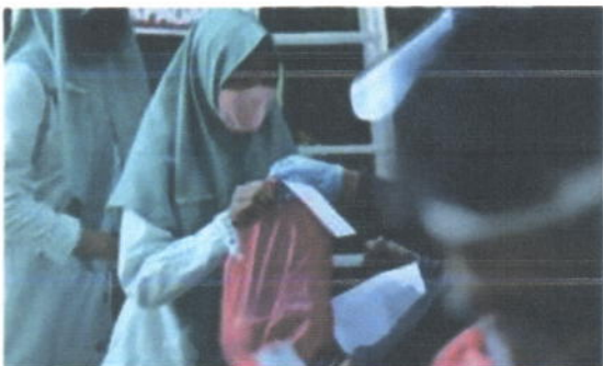
Pembagian daging hewan kurban kepada siswa penerima manfaat