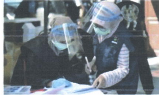
Proses cek seluruh data penerima manfaat daging hewan kurban