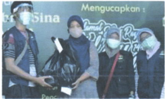
Pembagian daging hewan kurban kepada Perwakilan warga penerima manfaat