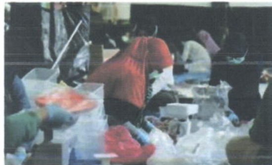
Proses penimbangan dan pengemasan daging hewan kurban