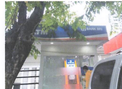
Kondisi Eksisting Signage