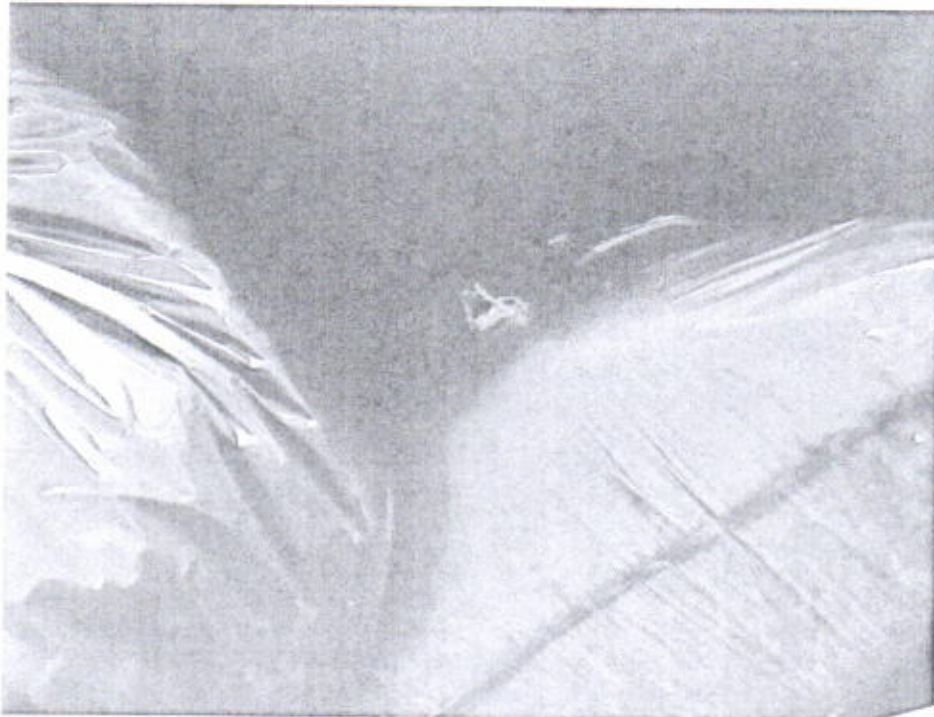
Gambar 2. Pengemasan Limbah Padat Domestik

Undaan Kulon 19 Surabaya 60274, Indonesia