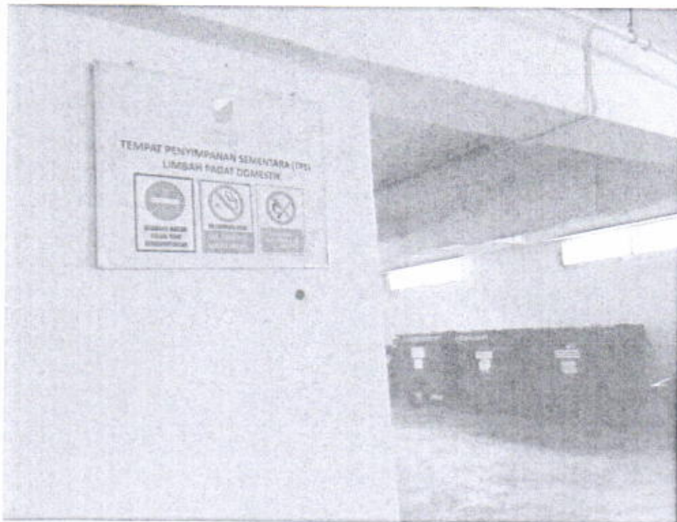
Gambar 4. Tempat Penyimpanan Sementara (TPS) Limbah Padat Domestik