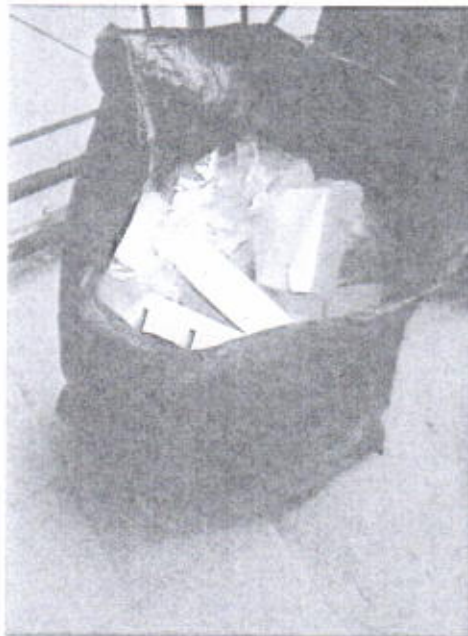
Gambar 3. Jenis Sampah yang dibuang