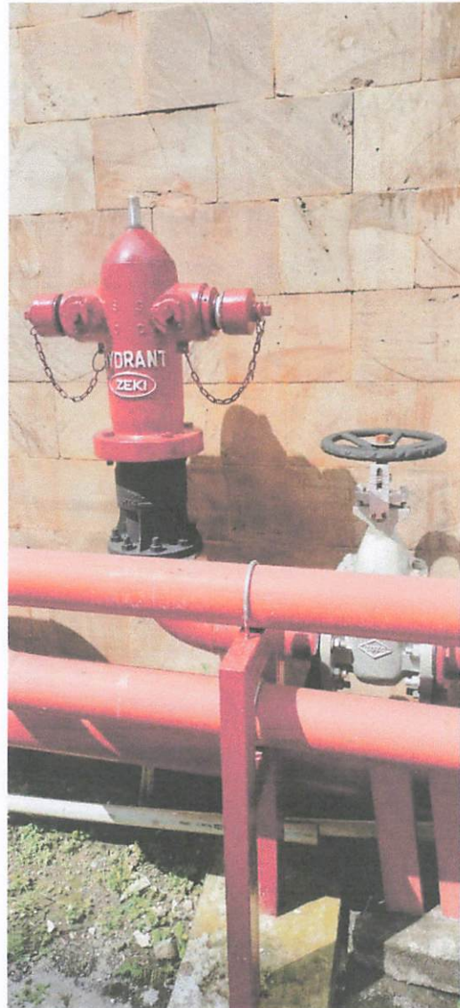
Hydrant Pillar bocor