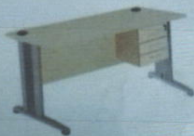
DD 120 T W 1200 X D 600 X H 750 (mm) + Laci