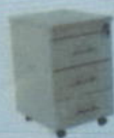
DMD 253 T W 400 X D 490 X H 630 (mm)