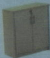
DBC 886 T W 800 X D 400 X H 860 (mm)