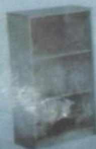
DBC 887 T W 800 X D 400 X H 1210 (mm)