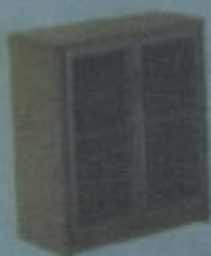
DBC 885 T W 800 X D 400 X H 860 (mm)