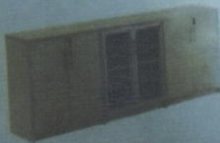
DBC 886 T. 2 F W 2350 X D 400 X H 860 (mm)