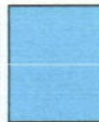
1 Halaman (14 x 21 cm)