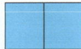
2 Page Profile (29 x 42 cm)