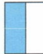
1/2 Halaman Vertikal (21 x 7 cm)