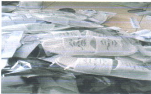
Sandal Hotel Rp. 4.250