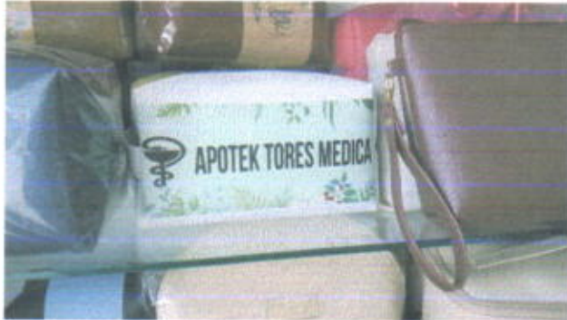
Aneka Pouch harga mulai Rp. 10.000