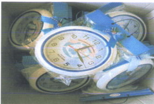
Aneka jam Dinding /jam duduk harga mulai Rp. 30.000