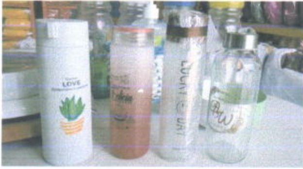
Aneka Thumbler harga mulai Rp. 13.000 – 20.000