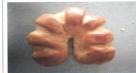
KAYA ROUND 4,500 TOPPING :- FILLING : SELAI SRIKAYA