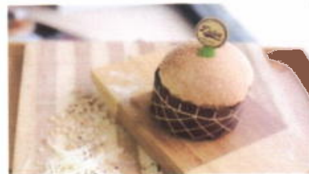
KAYA BUN 7,900 TOPPING : BREAD CRUMB FILLING : SELAI SRIKAYA