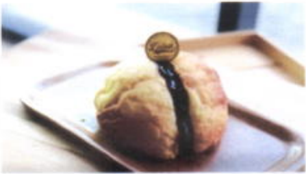
ROCKY BLUEBERRY 6,800 TOPPING : SELAI BLUEBERRY FILLING :-