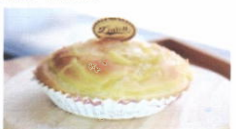
PUFF CHEESE 7,900 TOPPING : KEJU FILLING : KEJU SUSU