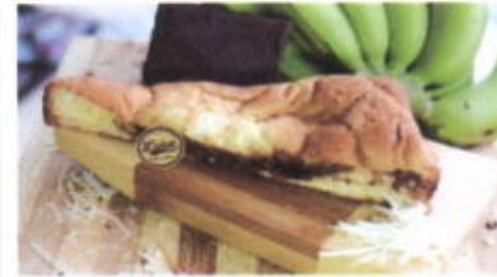
BANANA SPLIT 10,200 TOPPING : SUSU BUBUK FILLING : PISANG, FLA, COKLAT, KEJU