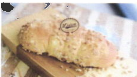
PEANUT BATON BREAD 5,600 TOPPING : KACANG, GULA FILLING : SELAI KACANG