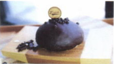
COCOA FUDGE 6,200 TOPPING : COKLAT, COKLAT CRISPY FILLING : -