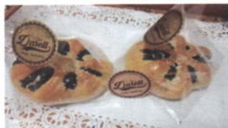
ALMOND CHOCO 4,500 TOPPING :- FILLING : COKLAT, KACANG ALMOND