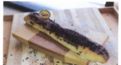
CHOCO STICK 6,800 TOPPING : KRIM MENTEGA, COKLAT MESES FILLING : KRIM MENTEGA