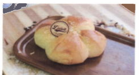
PINA TROPICA 5,100 TOPPING : KEJU FILLING : KEJU SUSU