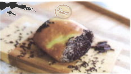
ROLL CHOCO 6,200 TOPPING : KRIM MENTEGA, MESES FILLING :-