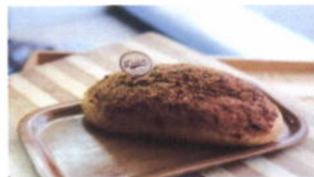
BEEF FLOSS BUN 12,500 TOPPING : ABON FILLING : MAYONAISE