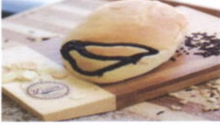
ULTRAMAN 5,100 TOPPING : COKLAT, KACANG ALMOND FILLING :-