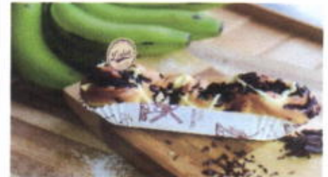
CHOCO BANANA BOAT 9,700 TOPPING : PISANG, COKLAT FILLING : -