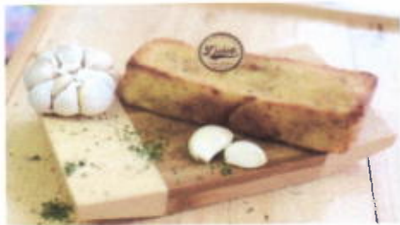
GARLIC BREAD 8,500 TOPPING : BAWANG FILLING :-