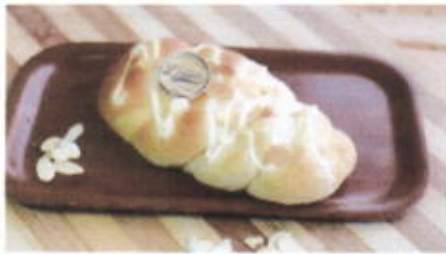
KEPANG DURIAN 8,000 TOPPING : KACANG ALMOND FILLING : FLA DURIAN