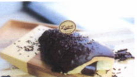
CHOCOLATE CAVE 8,500 TOPPING : COKLAT MESES, COKLAT LELEH FILLING : FLA COKLAT