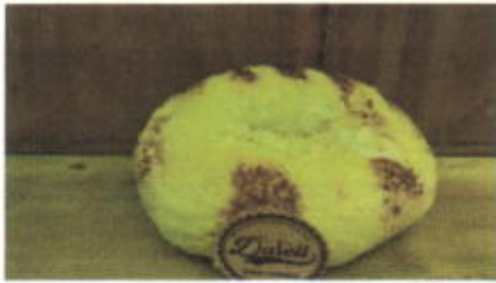
CHEESE FLOATIES 6,500 TOPPING : - FILLING : KEJU