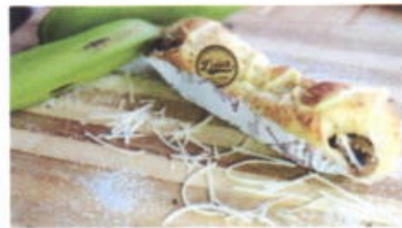
CHEESE BANANA BOAT 9,700 TOPPING : PISANG, FLA PISANG, KEJU FILLING :-