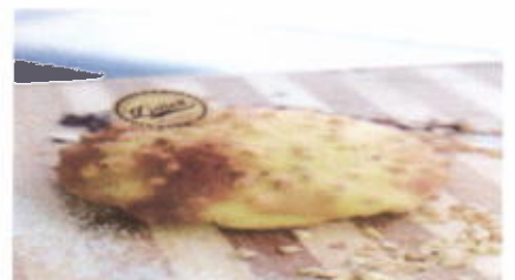
PEANUT MILK 6,800 TOPPING : KACANG FILLING : SUSU