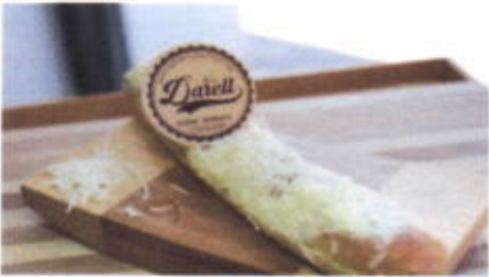
CHEESE STICK 6,800 TOPPING : KEJU PARUT FILLING : KRIM KEJU