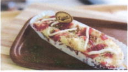
TUNA MELT 10,200 TOPPING : TUNA, WIJEN, KEJU, SAUS FILLING :-