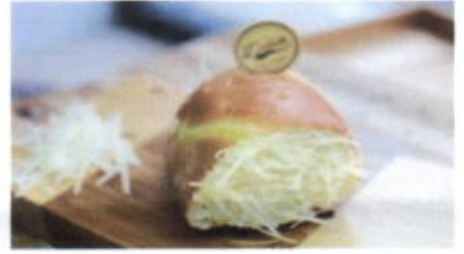
ROLL CHEESE 6,200 TOPPING : KRIM MENTEGA, KEJU FILLING :-