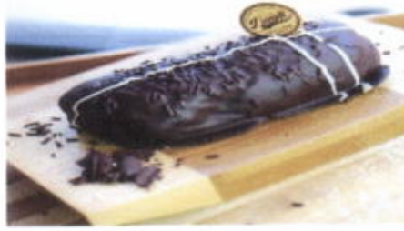
DARK SMOOTHY 9,700 TOPPING : COKLAT MESES, COKLAT LELEH FILLING : KRIM KEJU