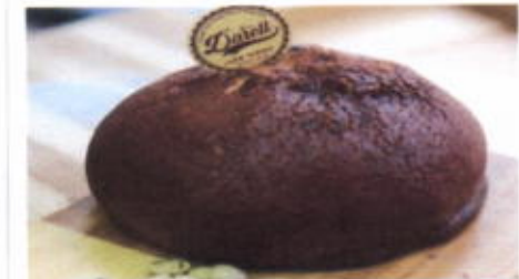
HERO 7,400 TOPPING : MOKA FILLING : MENTEGA ASIN