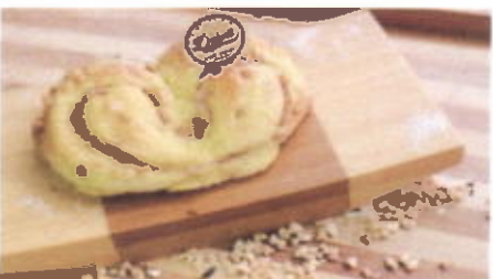
PEANUT MOOD 6,800 TOPPING : KACANG FILLING : SELAI KACANG