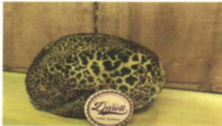
CHIX CHOX OREO 5,000 TOPPING : OREO FILLING : COKLAT