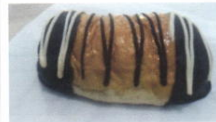
HONEY BANANA 8,500 7,400 TOPPING : COKLAT FILLING : PISANG