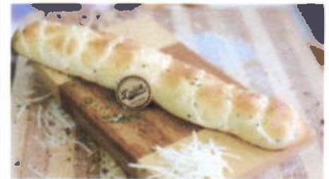
MCW 6,200 TOPPING : KEJU, MAYONAISE, PARSLEY FILLING :-