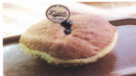
HOLE IN ONE 7,400 TOPPING : SELAI BLUEBERRY FILLING : SELAI BLUEBERRY