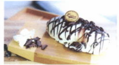
CHEESE SMOOTHY 9,700 TOPPING : COKLAT LELEH FILLING : KRIM KEJU