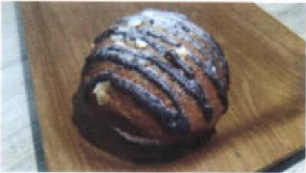
CHOCO SNOW 8,500 TOPPING : COKLAT, KACANG, GULA HALUS FILLING : -