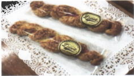
CRIS CROS BEEF SAUSAGE 7,900 TOPPING : KEJU FILLING : SOSIS