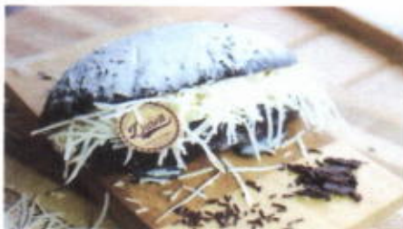
CHOCO CHEESE MONSTER 9,100 TOPPING : COKLAT, GULA HALUS FILLING : KEJU PARUT