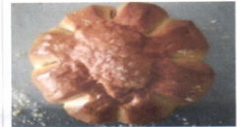
FLOWER O NUT 4,500 TOPPING : GULA FILLING : SELAI KACANG