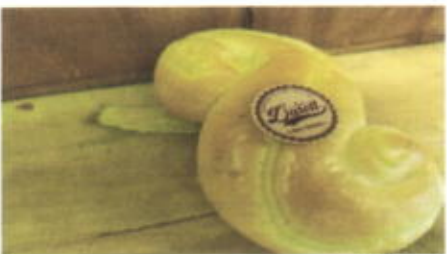
SUNNY GO 4,500 TOPPING : SELAI SRIKAYA FILLING : SELAI SRIKAYA