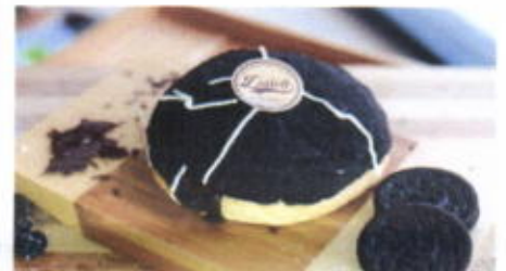
OREO BREAD 6,800 TOPPING : COKLAT, OREO FILLING : COKLAT