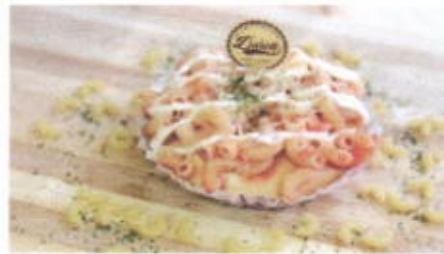
MACARONI BOLOGNESE 8,500 TOPPING : SAUS BOLOGNESE, MAKARONI, MAYO FILLING :-