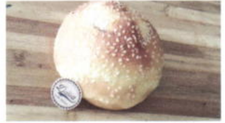
RED BEAN BUN 5,000 TOPPING : WIJEN FILLING : KACANG MERAH