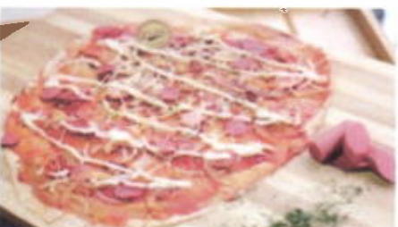
PIZZA CRISPY 11,400 TOPPING : SOSIS SAPI, TOMAT, MOZZARELLA FILLING :-