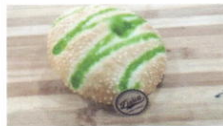
CEMPLON MELON 4,500 TOPPING : WUEN FILLING : FLA MELON