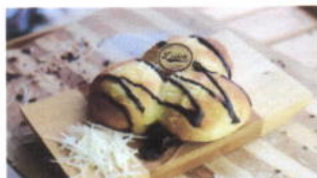
3 MUSKETEERS 7,400 TOPPING : COKLAT, KEJU FILLING : KEJU, SUSU, COKLAT