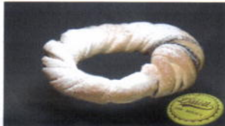
NUTELLA CHOCO 9,100 TOPPING : SELAI NUTELLA FILLING :-