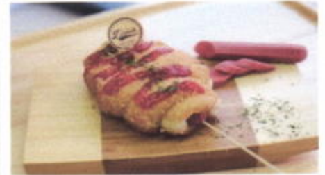
DONUT KATSU 8,500 TOPPING : PANIR ROTI, SAOS ISTIMEWA FILLING : SOSIS AYAM