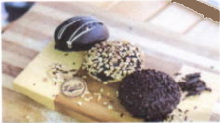
DONUT SATAY 6,800 TOPPING : COKLAT, MESES, KACANG FILLING :-