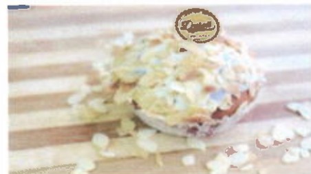
ALMOND BLOSSOM 7,900 TOPPING : KACANG ALMOND FILLING : FLA SUSU