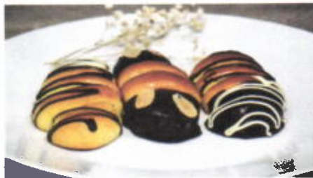
3 O BANANA 9,750 TOPPING : COKLAT, KACANG ALMOND FILLING : PISANG