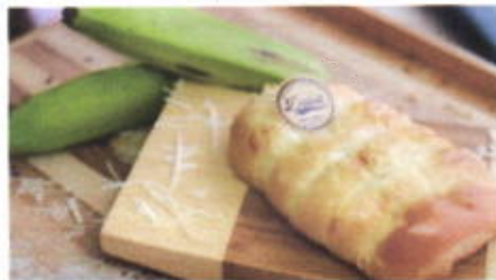
BANANA CHEESE 6,800 TOPPING : KEJU PARUT FILLING : PISANG, KEJU