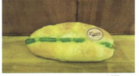
ZEBRA BREAD 4,500 TOPPING :- FILLING : FLA MELON