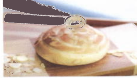
DURIAN ALMOND 6,800 TOPPING : FLA DURIAN FILLING : KACANG ALMOND