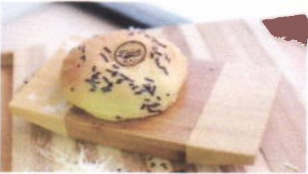
CHOCO BUN 6,800 TOPPING : MEXICO, COKLAT MESES FILLING : COKLAT