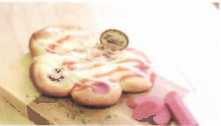
PIZZA BREAD 9,100 TOPPING : SOSIS, MAYONAISE, PARSLEY FILLING :-