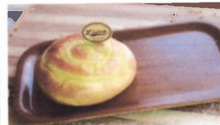
KAYA OISHI 5,100 TOPPING :- FILLING : SELAI SRIKAYA