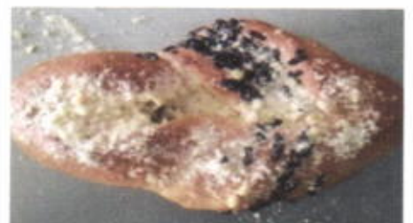
CHOCO CRUMB 4,500 TOPPING : - FILLING : COKLAT