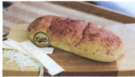
CHEESE LOVERS 8,500 TOPPING : KEJU PARMESAN FILLING : KEJU, SAOS