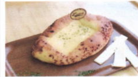
CHEESE BOAT 9,100 TOPPING : KEJU LEMBARAN, PARSLEY FILLING :-