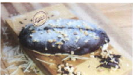
PICK ME UP 8,500 TOPPING : COKLAT, KACANG, GULA HALUS FILLING : KRIM TIRAMISU