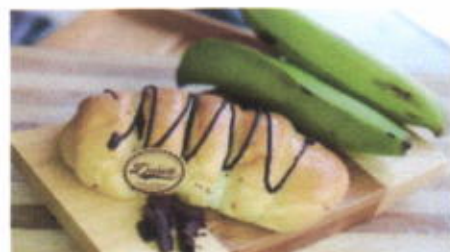
BANANA CHOCO 6,800 TOPPING : COKLAT LELEH FILLING : PISANG, COKLAT