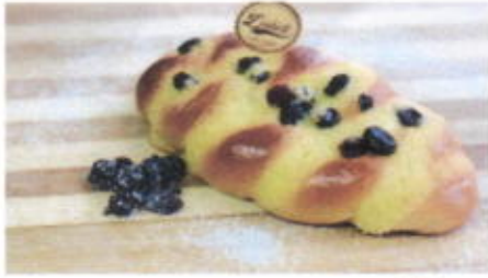
RAISIN BREAD 6,800 TOPPING : MEXICO, KISMIS FILLING :-