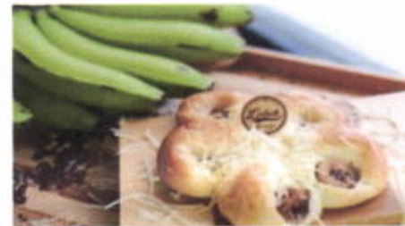
BANANA CHEESE FUN 7,400 TOPPING : KEJU PARUT, PISANG FILLING :-