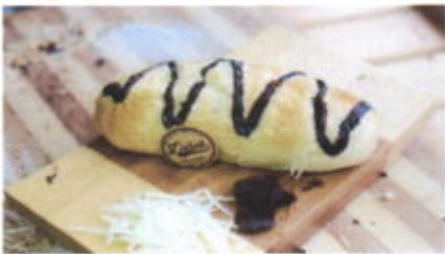
T2A 6,200 TOPPING : COKLAT, KEJU FILLING : COKLAT