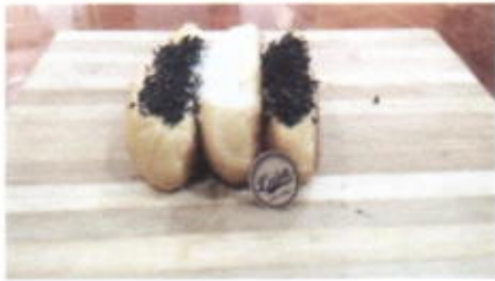
RAINBOW CHOCO 6,000 TOPPING : COKLAT MESES, MENTEGA, GULA FILLING :-