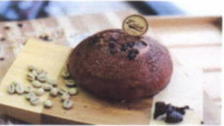
CHOCO HERO 6,800 TOPPING : MOKA, COKLAT CHIP FILLING : COKLAT