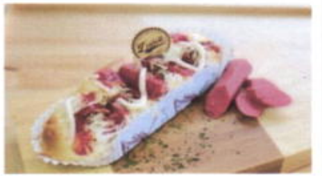
THE DIVA 9,100 TOPPING : SOSIS, KEJU, SAUS, PARSLEY FILLING :-