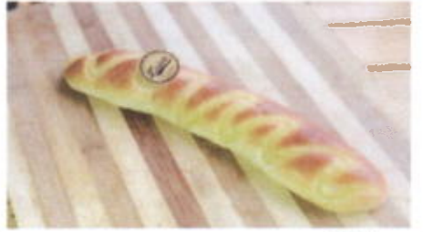
STAIRWAY TO HEAVEN 6,800 TOPPING : SUSU FILLING : KRIM SUSU