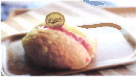
ROCKY STRAWBERRY 6,200 TOPPING : SELAI STRAWBERRY FILLING :-