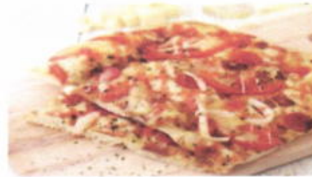
BEEF MILANO 11,400 TOPPING : SOSIS SAPI, BAWANG BOMBAY, SAOS FILLING :-