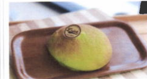
KACANG IJO 6,200 TOPPING : MEXICO HIJAU FILLING : KACANG HUJAU