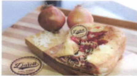
MEET THE CHEESE 11,400 TOPPING : SAUS, KEJU CHEDDAR, BOMBAY FILLING :-