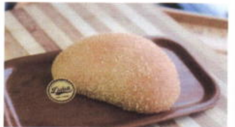
COCONUT 6,200 TOPPING : KELAPA KERING FILLING : SELAI KELAPA