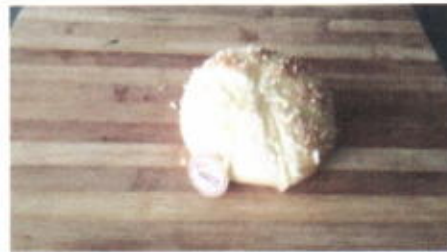
BANANA SPIDER 4,500 TOPPING : PANIR ROTI FILLING : FLA PISANG