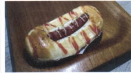
BEEF SAUSAGE BUN 8,500 TOPPING : SOSIS SAPI, SAOS, MAYONAISE, PARSLEY FILLING :-