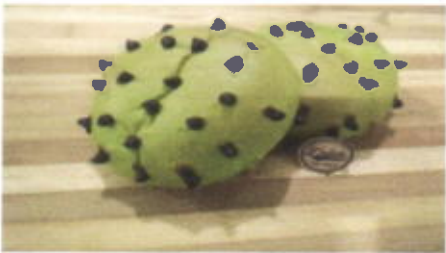
PANDAN CHOCO LAVA 6,500 TOPPING : COKLAT CHIP FILLING : FLA COKLAT