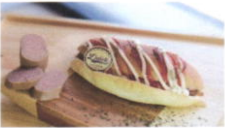
SOSIS BURGER 10,200 TOPPING : SAUS, MAYONAISE FILLING : KEJU LEMBARAN, SOSIS SAPI, SAUS