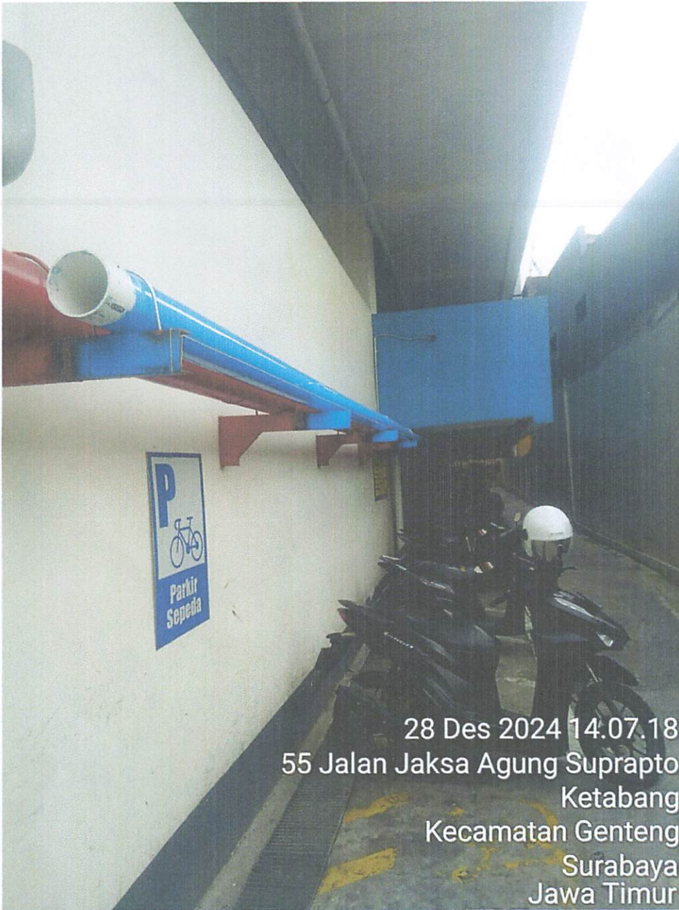
28 Des 2024 14.07.18 55 Jalan Jaksa Agung Suprpto Ketabang Kecamatan Genteng Surabaya Jawa Timur