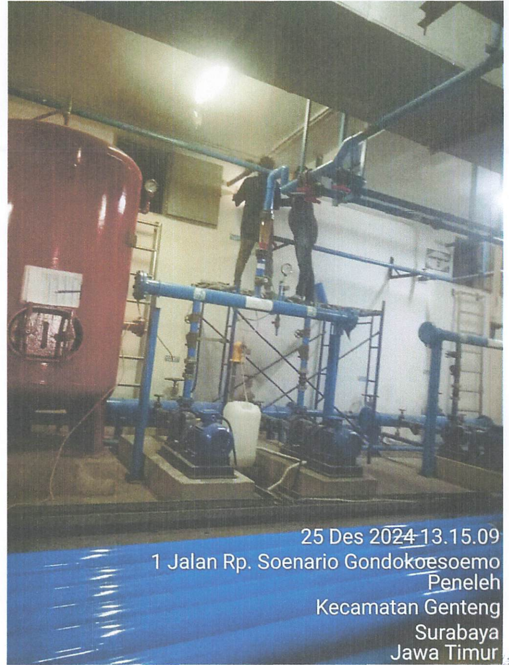
25 Des 2024 13.15.09 1 Jalan Rp. Soenario Gondokoesoemo Peneleh Kecamatan Genteng Surabaya Jawa Timur