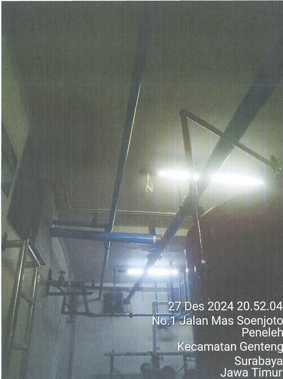
27 Des 2024 20.52.04 No.1 Jalan Mas Soenjoto Peneleh Kecamatan Genteng Surabaya Jawa Timur