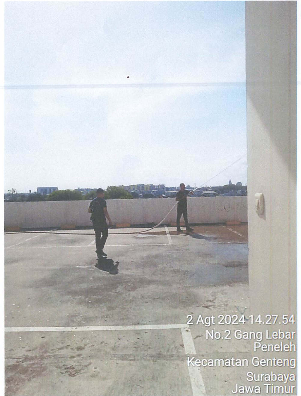
2 Agt 2024 14.27.54 No.2 Gang Lebar Peneleh Kecamatan Genteng Surabaya Jawa Timur