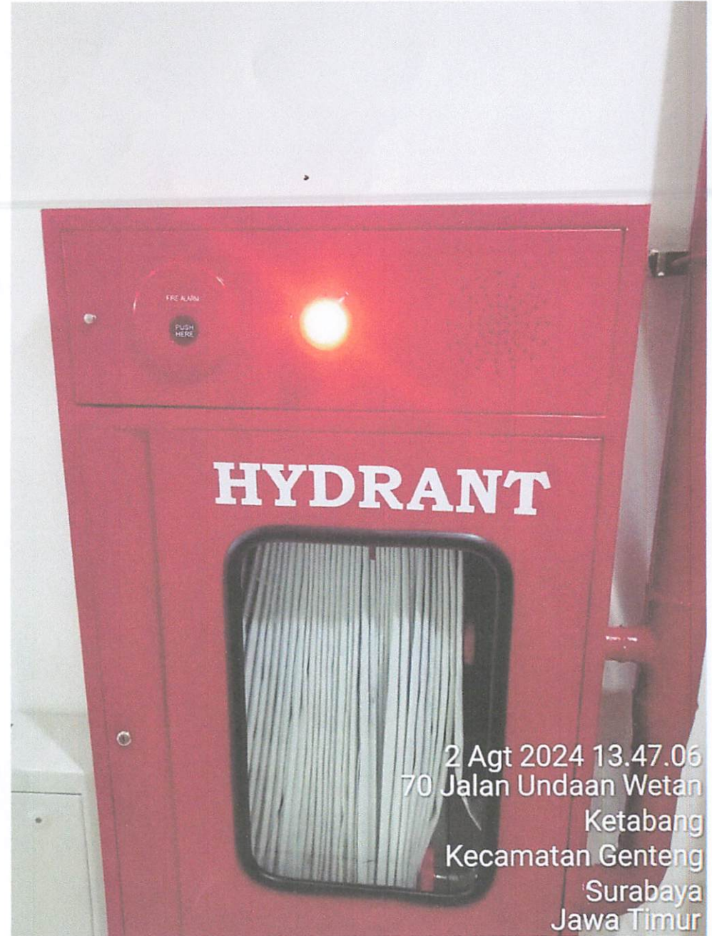
2 Agt 2024 13.47.06 70 Jalan Undaan Wetan Ketabang Kecamatan Genteng Surabaya Jawa Timur