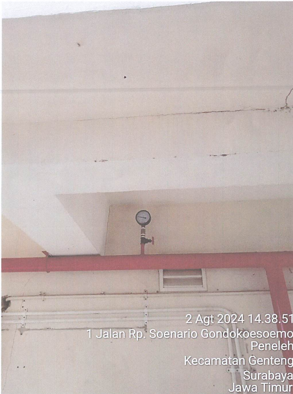
2 Agt 2024 14.38.51 1 Jalan Rp. Soenario Gondokoesoemo Peneleh Kecamatan Genteng Surabaya Jawa Timur