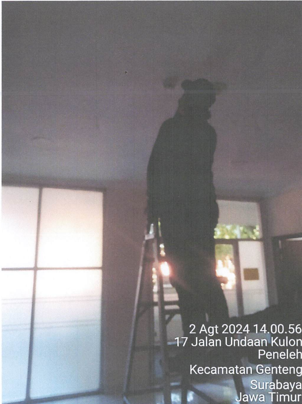
2 Agt 2024 14.00.56 17 Jalan Undaan Kulon Peneleh Kecamatan Genteng Surabaya Jawa Timur