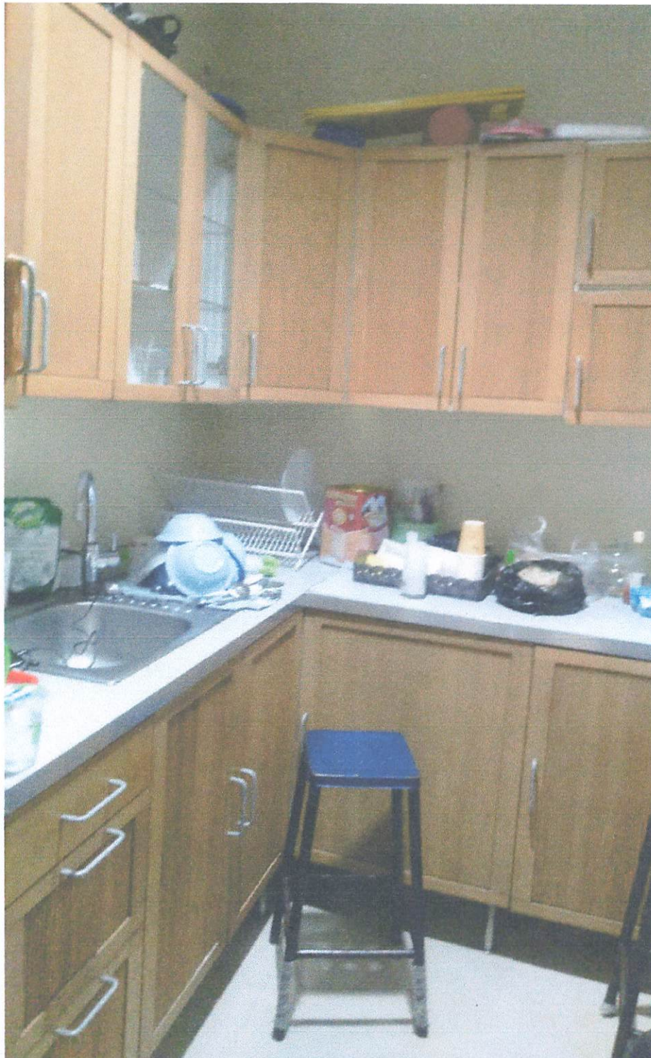
Gambar 3. Kitchen Set 2