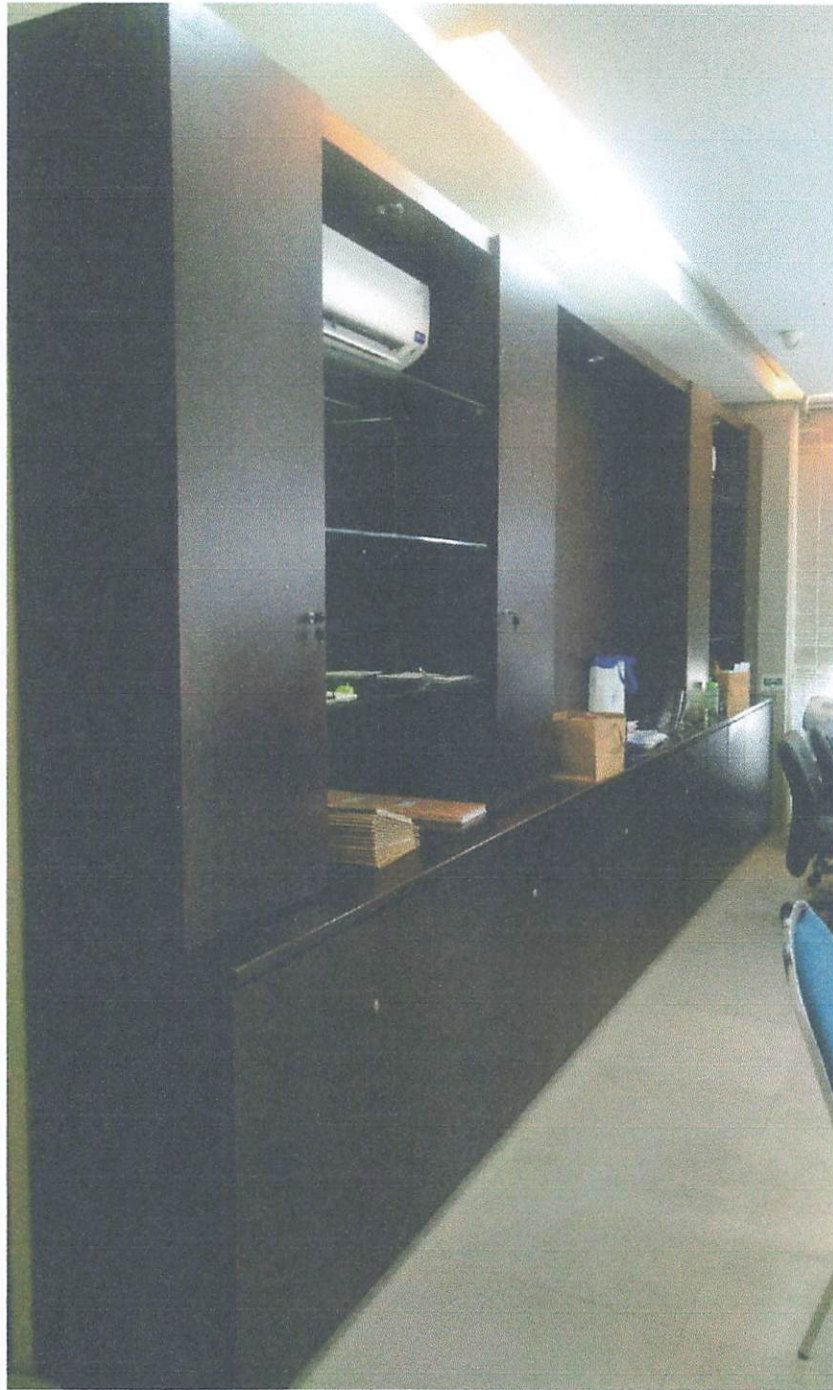
Gambar 2. Lemari Arsip