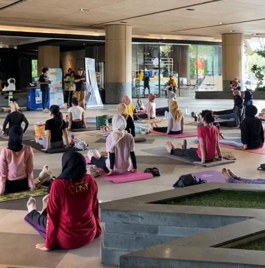
Suasana yoga di Lagoon Avenue Sungkono