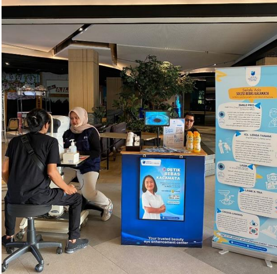
Booth dan lokasi pemeriksaan