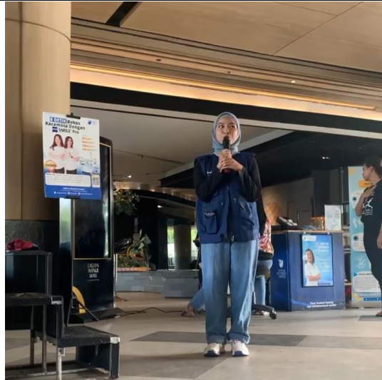
Pengenalan SMILE Pro singkat kepada peserta