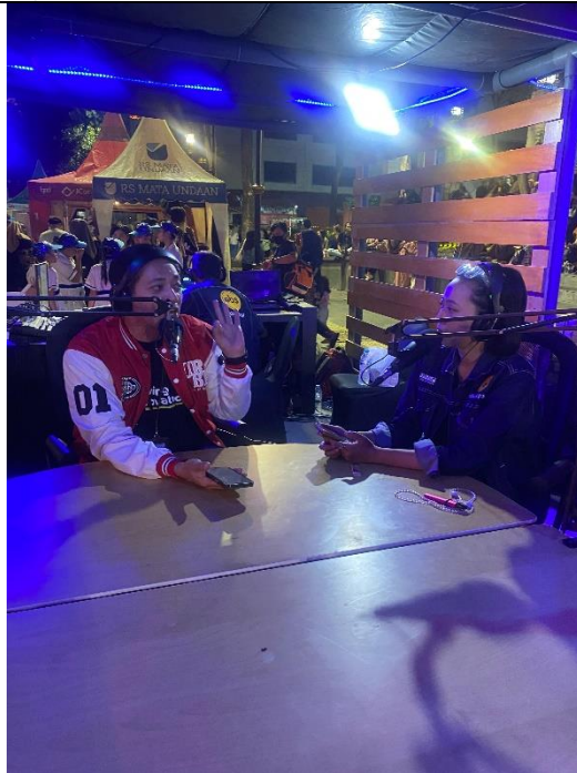
Promo Talkshow 60 detik di radio