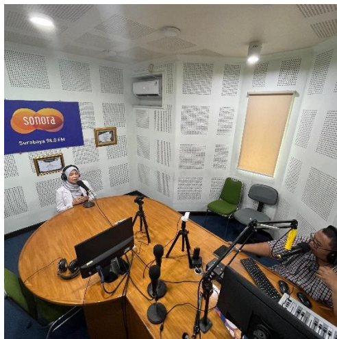
Live Report di studio Radio Sonora