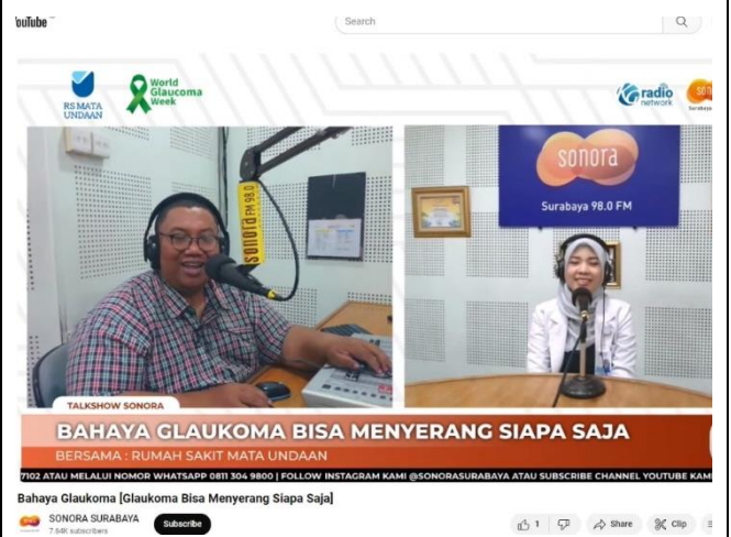
Youtube Sonora Radio