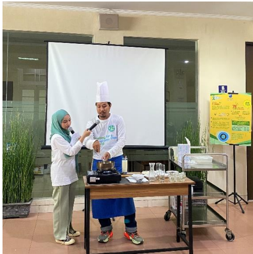
Demo masak oleh Instalasi Gizi RSMU