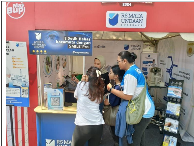
Edukasi Proses SMILE Pro