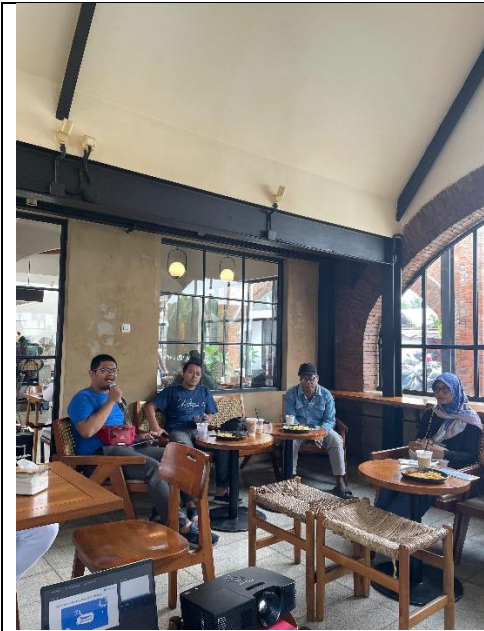
Tanya Jawab Peserta