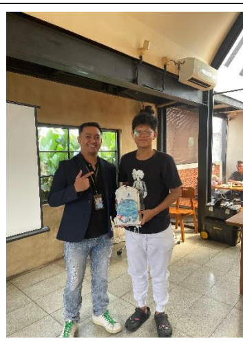
Foto Bersama Calon Pasien LASIK