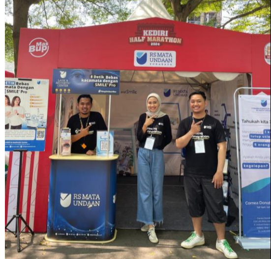
Foto Bersama Team