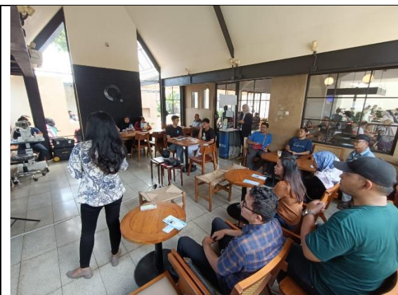
Kegiatan SMILE Talk