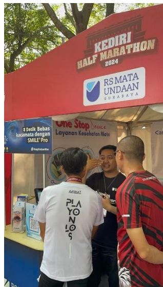
Edukasi SMILE Pro