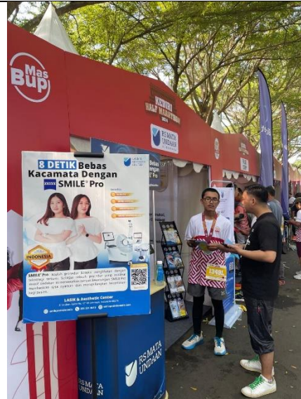
Memberikan Informasi Pelayanan RSMU