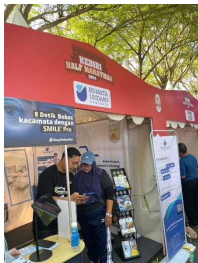
Pengisian Data Peserta Umum