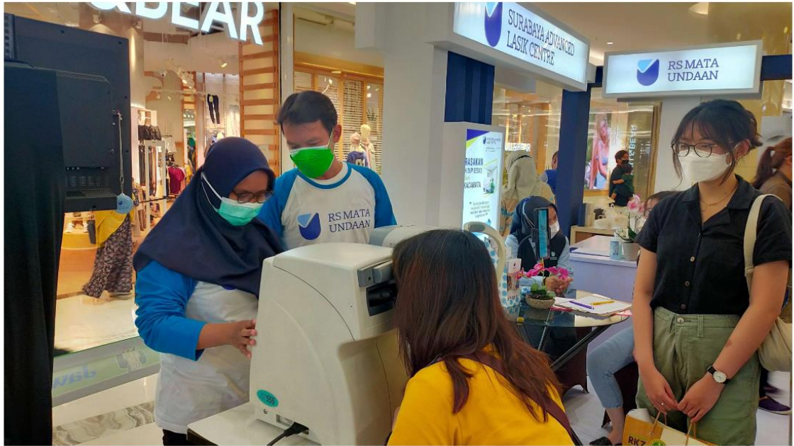
Booth RS Mata Undaan dalam gelaran Jawa Pos Health Care Expo yang dihelat pada 19-21 November 2021 di Pakuwon Mall Surabaya.