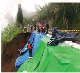
LONGSOR: Petugas menutupi jalan akses menuju kawasan wisata Bromo Tenger Semeru (BTS) yang longsor dengan terpal.