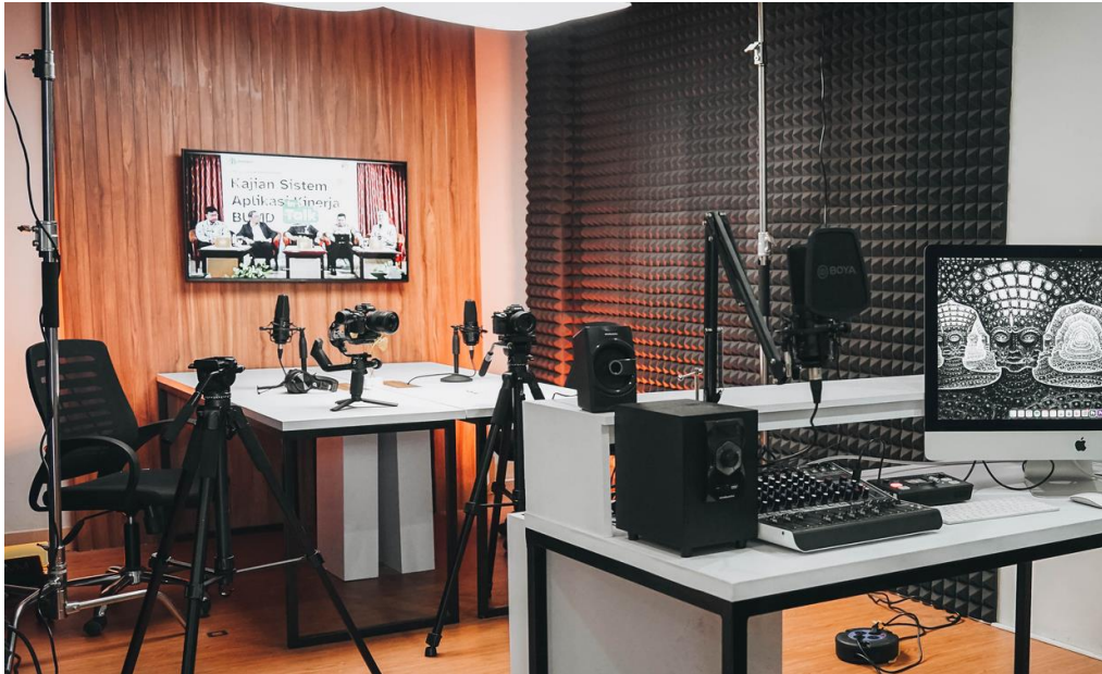
Preview Studio A. 2 - 4 orang narsum (Wall Panel + railing di bagian belakang, wooden floor panel, meja operator, tripod kamera, TV Monitor)